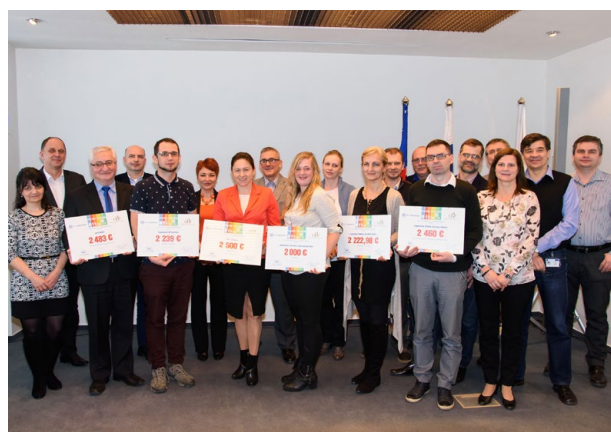
Zástupcovia šiestich organizácií z Košického a Prešovského kraja so symbolickými šekmi z programu Spoločne pre región.