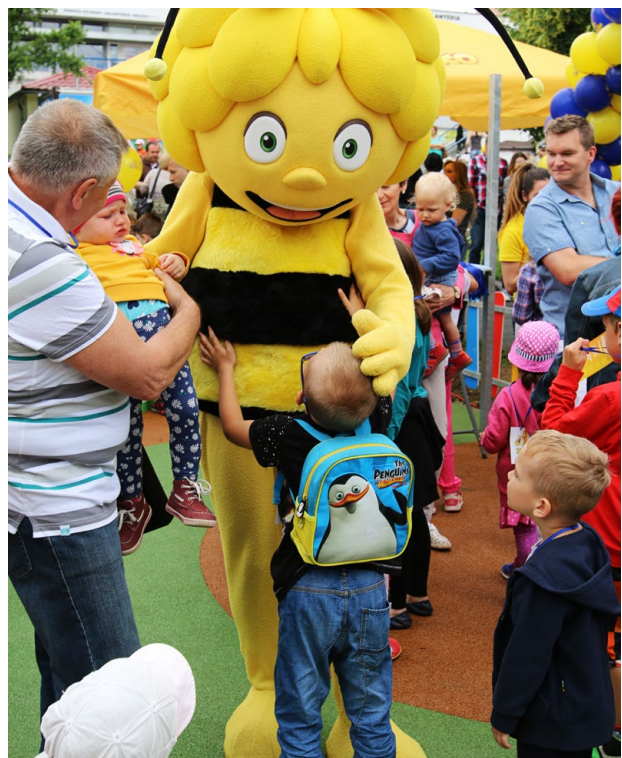
Desaťtisíce ľudí a celé mestá sa usilovne snažili získať krásne ihrisko práve pre svoje mesto.

herné prvky sa nesú vo veselých a hravých motívoch s podobizňami Včielky Maje a jej priateľov. Samozrejmosťou sú lavičky, odpadkové koše a stojisko na bicykle. Hodnota ihrísk je spolu 870 000 eur.