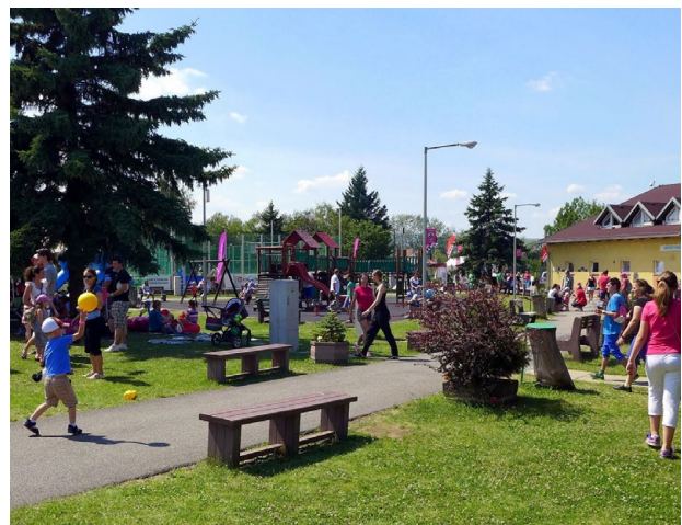
Jedinečný priestor Alejová vylepšuje život v meste malým aj veľkým Košičanom.

Alejová nezabúda ani na seniorov, ktorí si môžu zahrať petangue, stolný tenis, golf a šipky. Pre všetkých je k dispozícii letný altánok s možnosťou grilovania, no a ďalšími atrakciami sú napríklad kolky, hovoriaca lavička, jazierko, speedminton, nafukovacia vranka, detské ihrisko či stena na lezenie. Malý externý amfite-