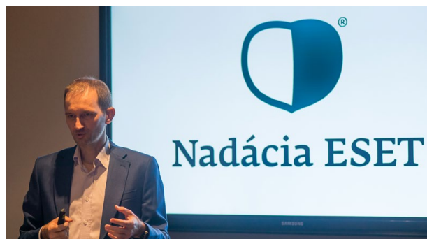
K združeniu zodpovedných firiem sa v marci pridala aj spoločnosť ESET.

Cieľom spoločnosti HPE je maximálne možné zníženie negatívnych dopadov na životné prostredie. Firma okrem obligátnych činností ako recyklovanie, ekologické spracovávanie nebezpečného odpadu a využívanie dopravných prostriedkov s čo najmenšou mierou