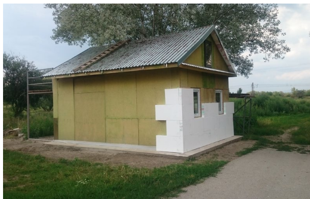
Skupina VSE Holding darovala bubnové káble, ktoré poslúžili pri výstavbe domčeka pre ľudí v núdzi.

Koncom minulého roka darovala VSE centru Oáza – Nádej pre nový život niekoľko kusov bubnových káblov, ktoré bežne slúžia ako obalový materiál pri preprave elektrických káblov. Zatiaľ čo za normálnych okolností by po splnení svojho účelu smerovali tieto bubny na skládku, centrum Oáza ich využilo ako stavebný materiál pri výstavbe domčeka, ktorý poskytne strechu nad hlavou 5 – 6 ľuďom bez domova či viacčlennej rodine. „Ide o pilotný projekt,