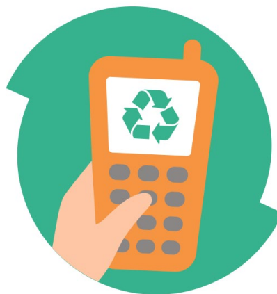
Zamestnanci členských firiem BLF Veolia a Deloitte prispeli do zbierky ďalšími 200 nepotrebnými mobilnými telefónmi.

Každý z nich čaká rovnaký osud, pričom pomôže hneď dvakrát. Jednak jeho ekologické zlikvidovanie chráni samotnú prírodu a jednak sa každé zariadenie premení na 50 centov určených na podporu dobrej veci. Tentoraz bol finančný výťažok zo zbierky určený na podporu neziskovej organizácie Dobrý anjel, a teda rodinám s deťmi, v ktorých jeden z rodičov alebo deti trpia rakovinou alebo inou zákejnou chorobou. Vďaka nepotrebným mobilom a ekologicky citiacim zákazníkom Dobrému anjelovi putovala suma 9 350 eur.